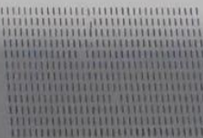
( BK )

Si aún se ven líneas, aunque los bloques de color estén bien colocados y sin huecos, pruebe la función "Corr la aliment. del papel" del menú de mantenimiento.